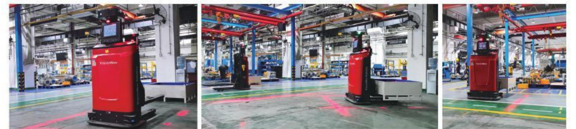
その他製造業や 物流倉庫 Others